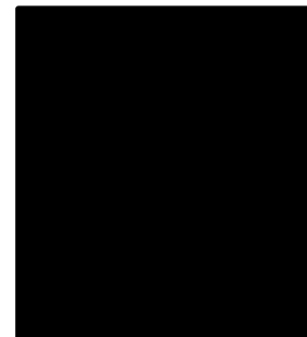
Ghrib Meriem (D-6215)